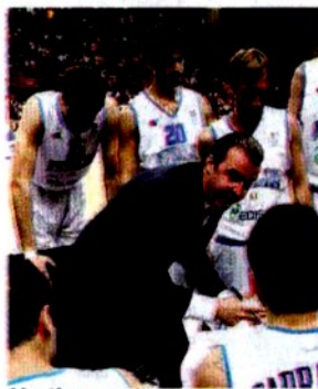
Un time-out azzurro

non fa piacere agli avversari, ma non è considerato provocatorio e non scatena l'irritazione della gente. Così come qualche nostalgico dei liberi tirati da sotto, co-