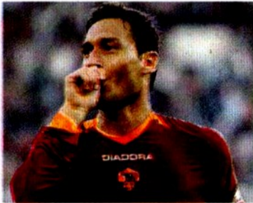
Totti dopo il suo gol al Catania

I l gol è il sale del calcio, basta non esagerare. Tra cucchiari, sombrero, tunnel e affini, niente fa più infuriare calciatori e dirigenti (sconfitti) di una squadra che, a loro modo di vedere, infierisce sull'altra.