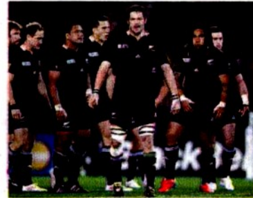
Richie McCaw e i suoi All Blacks

N iente pietà, siamo All Blacks! Eh già, perché se nel calcio è sconveniente infierire sull'avversario alla deriva, nel rugby è... obbligatorio. Il rispetto per l'avversario sta proprio nell'infliggergli più punti possibili. E in questo, ovviamente, gli All Blacks neozelandesi sono maestri. Il record, in una partita di Coppa del Mondo, appartiene a loro: 145-17 al Giappone a Sudafrica 1995. Non di rado, in una loro partita, vedrete il calciatore andare in piazzola per tre punti assolutamente superflui anche a punteggio largamente acquisito. Fermarsi, cincischiare, non segnare: è questo nel rugby il modo migliore di irridere l'avversario. E magari scatenare una rissa.