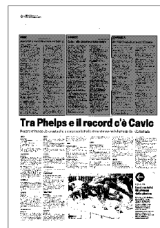
Tra Phelps e il record c'è Cavallo

Dressage individuale. TRAMPOLINO 5-7.30 Elimin. uomini (Cannone) e donne. HOCKEY 2.30-16.30 Elimin. donne. LOTTA 3.30-10.50 Elimin./ FINALE Libera 48kg, 65kg donne. NUOTO 4.03 FINALE 200 dorso donne; 4.10 FINALE 100 farfalla uomini; 4.16 FINALE 800 sl donne (Filippi); 4.39 FINALE 50 sl. uomini; 4.54 semif. 50 sl donne. PALLAMANO 3-16.15 Elimin. uomini. PALLANUOTO Elimin. uomini Gr. A: 4.50 Canada-Grecia; 8 Spagna-Montenegro; 9.20 Australia-Ungheria. Gr. B: 3.30 Germania-ITALIA; 6.10 Croazia-Usa; 10.40 Serbia-Cina. PALLAVOLO Elimin. uomini Gr. A: 4 Usa-Cina; 14.30 ITALIA-Bulgaria; 16 Venezuela-Giappone. Gr. B: 6 Russia-Egitto; 6.30 Serbia-Germania; 20 Brasile-Polonia. PESI 15 FINALE +75kg donne. SCHERMA 3-13.30 Elimin./ FINALI fioretto squadre donne (Granbassi, Salvatori, Trillini, Vezzali). SOFTBALL 3.30-15.30 Elimin. (4ª partita) TENNIS 10-16 FINALE singolare donne; FINALE doppio uomini. TENNISTAVOLO 4-16 Semif. squadre uomini. TIRO A SEGNO 3-6 Elimin./ FINALI pistola automatica 25m uomini. TIRO A VOLO 3-9 Elimin./ FINALI Skeet uomini (Benelli, Falco). TUFFI 14 Semif. 3m donne. VELA 7 MEDAL RACE Finn; 8 MEDAL RACE Yngling; 79, 89 regata RS:X (Heiddeger, Sensini); Laser (Romero); Laser Radial (Nieverov); 99, 109 regata 470 (Trani- Zandonà, Conti-Micol); 39, 49 regata Tornado (Marcolini- Bianchi), Star (Negri-Viali).