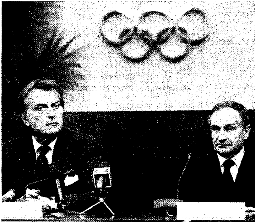
Coppia Petrucci è d'accordo sulla candidatura di Montezemolo