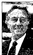
Sopra, Luca Cordero di Montezemolo

Bisognerà chiarire le regole in base alle quali costruire il villaggio