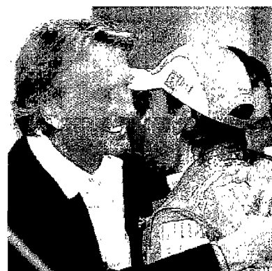
Luca Montezemolo assieme a tre grandi piloti della "sua" Ferrari: da sinistra Niki Lauda (1974-77), Michael Schumacher (1996-06) e Fernando Alonso (2009-oggi)