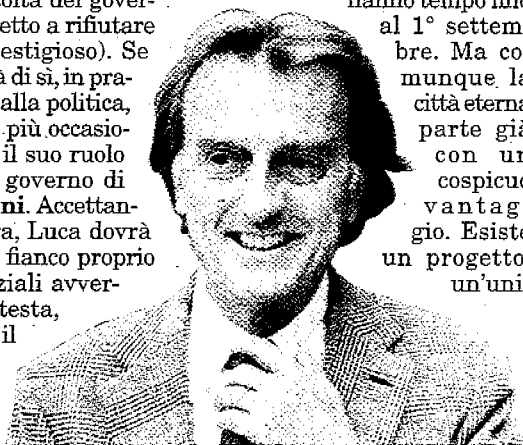
Luca Cordero di Montezemolo