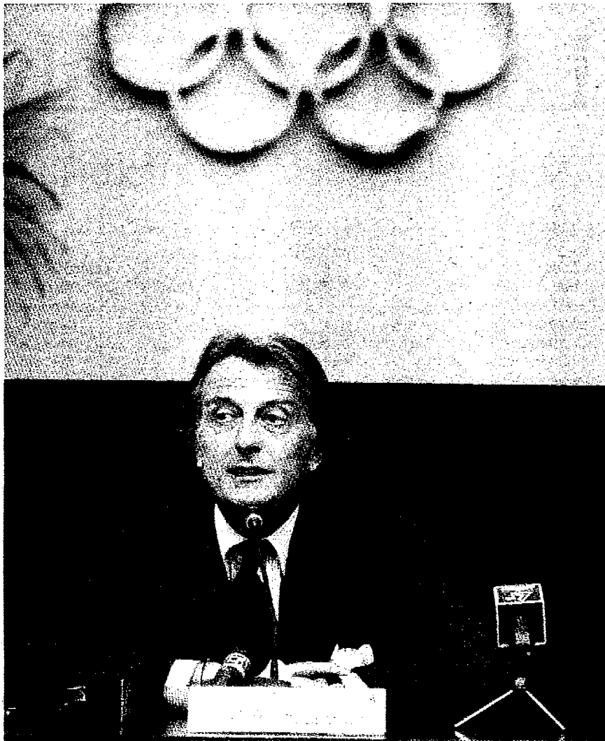
Luca Montezemolo, 63 anni, presidente della Ferrari