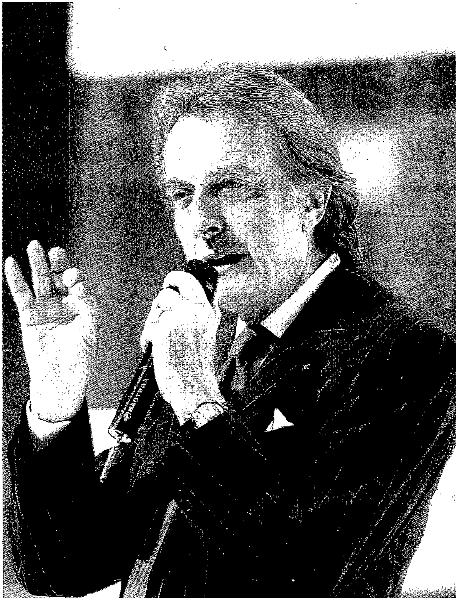
Luca Montezemolo, 63 anni, presidente della Ferrari ed ex numero 1 della Fiat