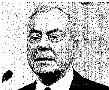
Gianni Letta, 75 anni