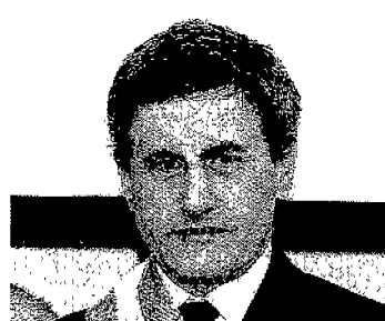
Gianni Alemanno, 52 anni